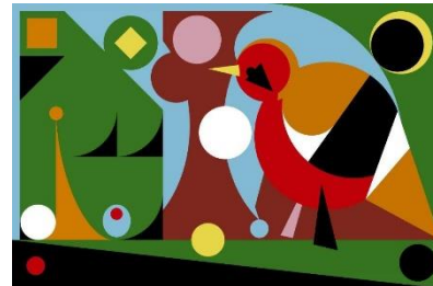
Ad Minoliti, Bird, 2023, Acryl auf Leinwand, 100x150cm, Courtesy Peres Projects

Anmeldung: erforderlich bis einen Tag vor Termin